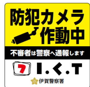
お客様に配布予定のステッカー例