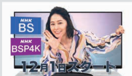
NHKアナウンサー 杉浦友紀

2023年12月に番組改定を行い、 「NHK BS」と「NHK BS プレミアム4K」がスタートします。